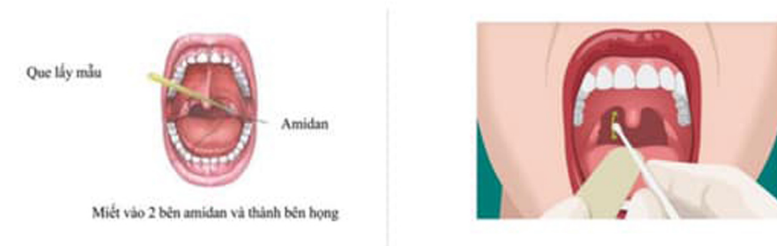
Hình 2: Lấy mẫu ngoáy dịch họng