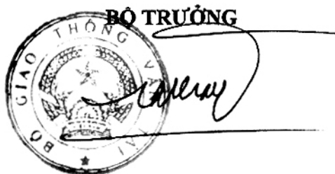
Đinh La Thăng